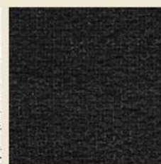
Camo Form® Black