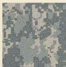
ARMY Digital (ACU)