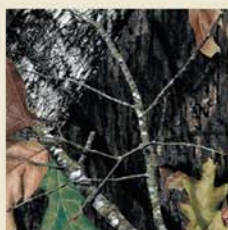
Mossy Oak® Break Up