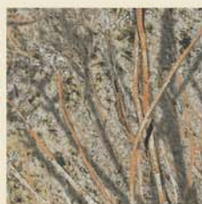
Mossy Oak® Brush