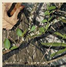
Mossy Oak® Obsession