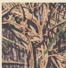
Mossy Oak® Shadowgrass